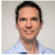
C.F. Müller Verlag Sven Hübler